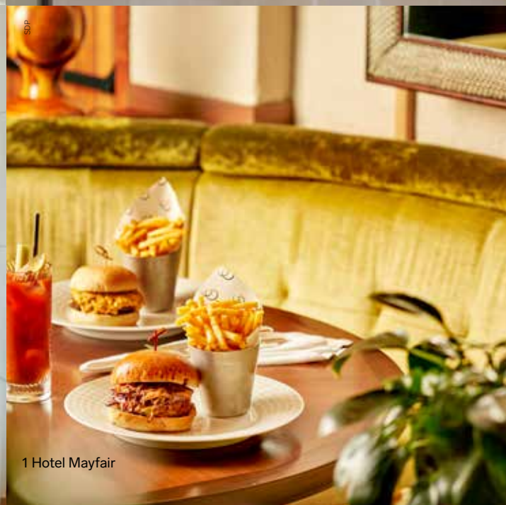
1 Hotel Mayfair