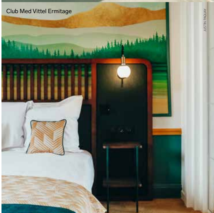
Club Med Vittel Ermitage