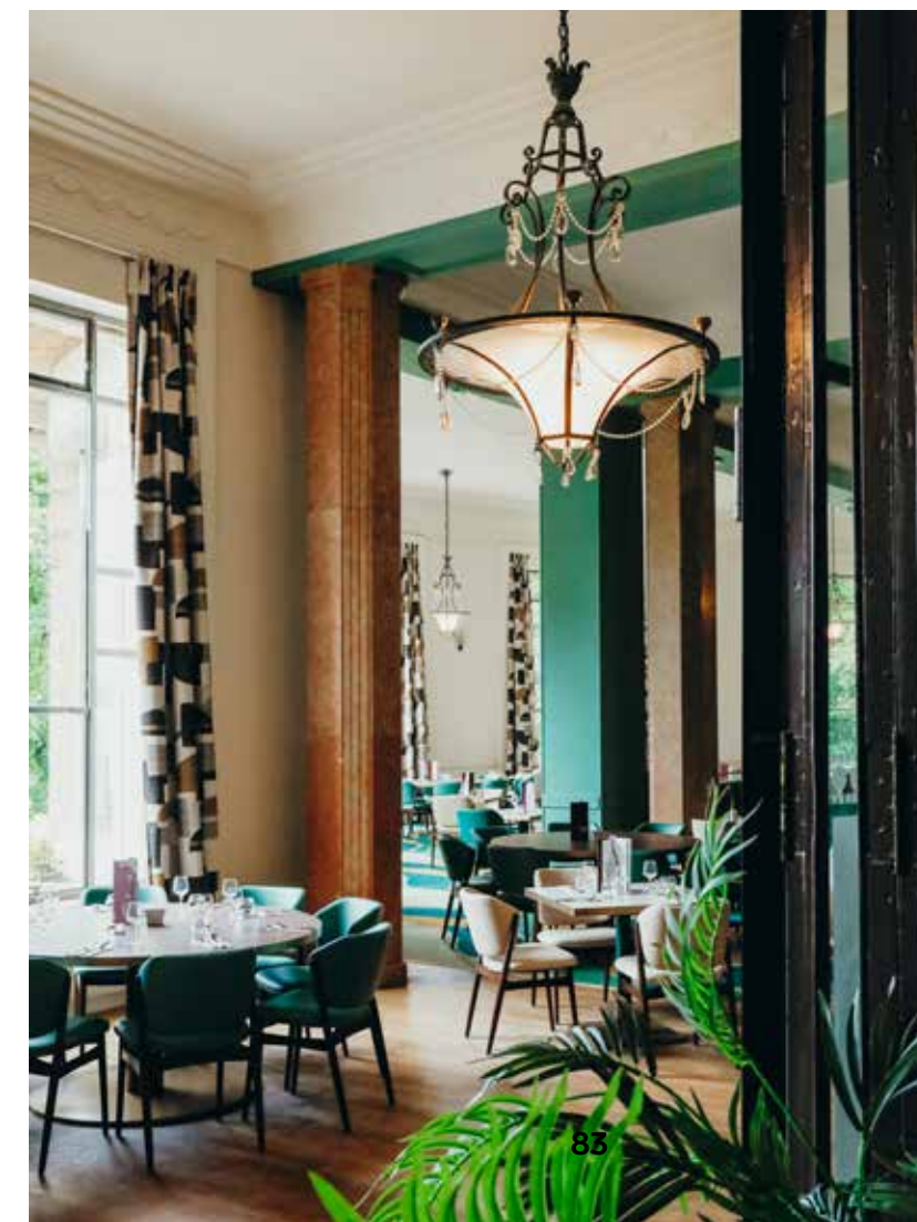
BEELDEN JUSTIN PAQUAY